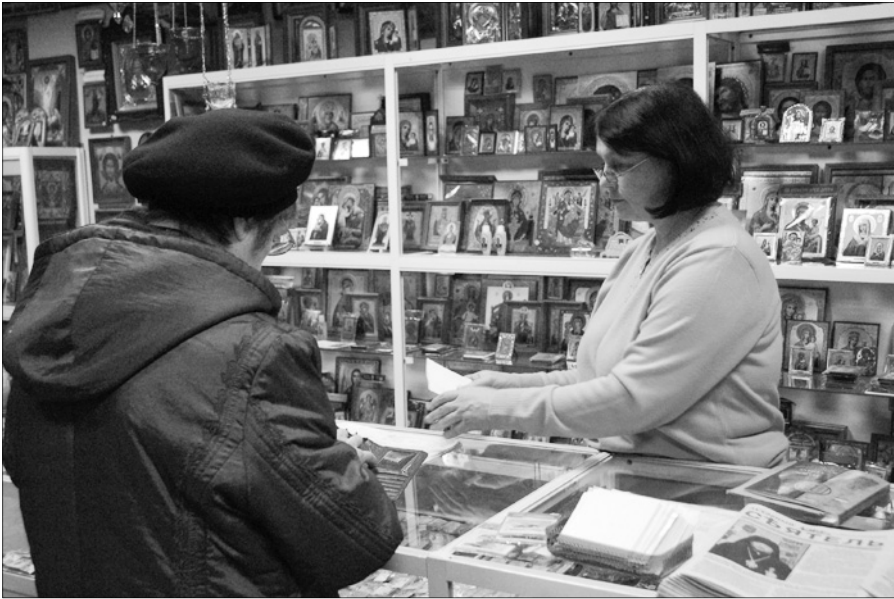
Фото иерод. Феофила.

Жители нашего города хорошо знают магазин Антониево-Сийского монастыря «Иконы-книги». Немало здесь постоянных покупателей,