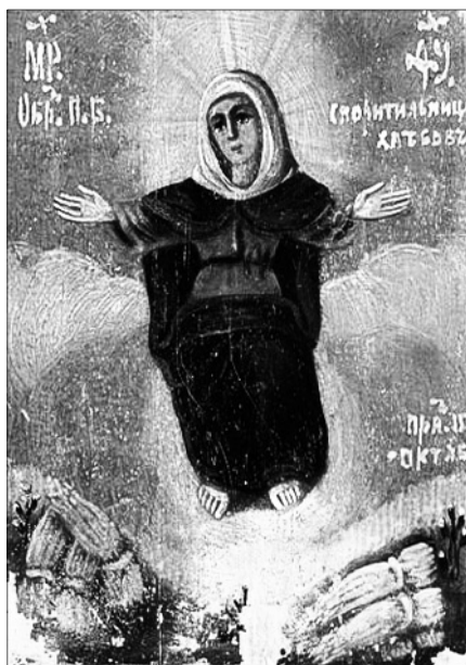
Образ Божией Матери «Спорительница хлебов». Оптина пустынь.

28 октября — иконы Божией Матери «Спорительница хлебов» (XIX в.).