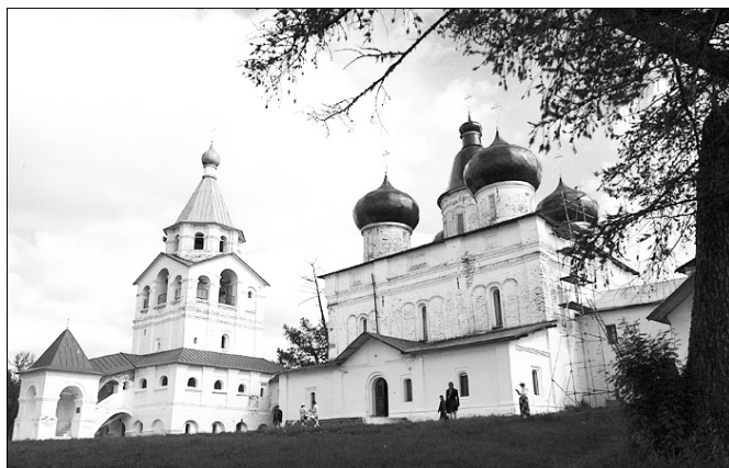
фото иерод. Феофила.

Телефон паломнической службы +7 911 593 33 63.